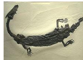
Ricostruzione di Lariosaurus balsami

E' un rettile acquatico estinto, appartenente ai notosauri, vissuto nel Triassico medio (Anisico - Ladinico, circa 245-235 milioni di anni fa). I suoi resti fossili sono stati ritrovati in Europa (Italia, Svizzera, Spagna, Francia) e in Asia (Israele e Cina). E' noto per numerosi esemplari, provenienti per lo più dal Nord Italia.